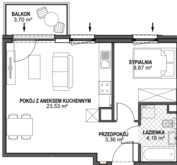
SCHEMAT KONDYGNACJI Z LOKALIZACJĄ MIESZKANIA

Kształt i wielkość balkonów (tarasów) oraz szachtów wentylacyjnych może ulec zmianie.